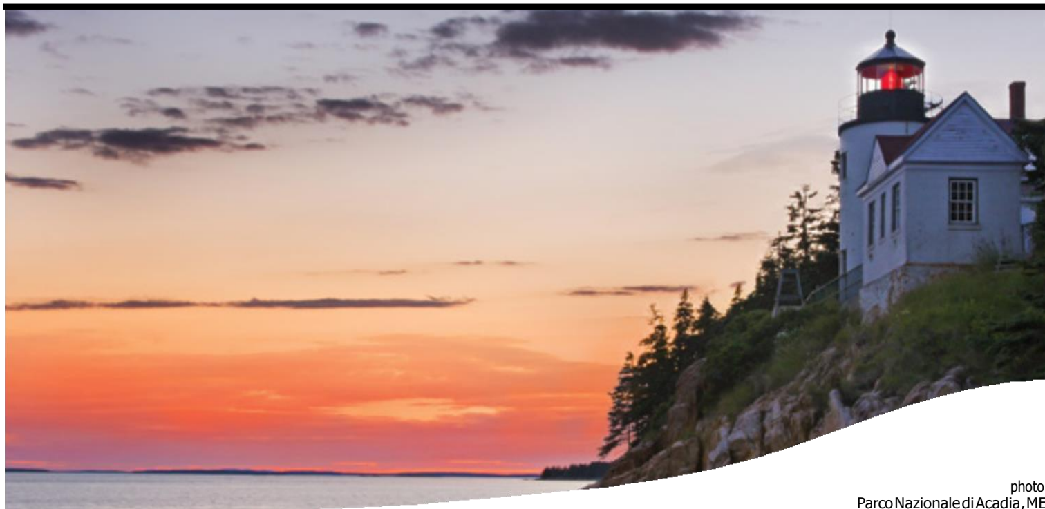
photo: Parco Nazionale di Acadia, ME

12 giorni / 11 notti. Tutto l'anno. Inizio/Fine tour: Boston, MA