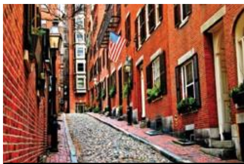
photo: Boston, MA—Il Freedom Trail Boston, MA—Il caratteristico quartiere di Beacon Hill